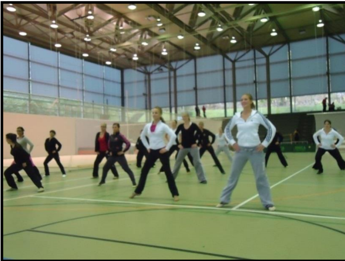
Module twirling à Macolin en 2012.

Le parcours du moniteur de twirling nécessite en premier lieu une formation JS. Les moniteurs qui entraînent des athlètes faisant partie du cadre national de la relève, suivent en principe un module propre au twirling chaque année.